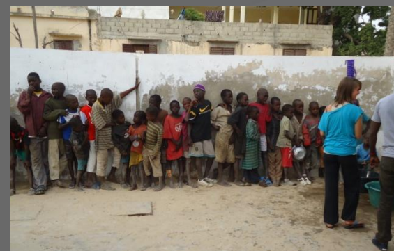
3) Distribuzione delle merende nel Centro