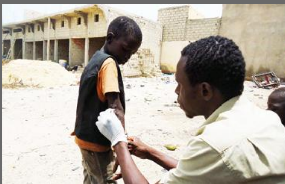
4) Interventi d'emergenza