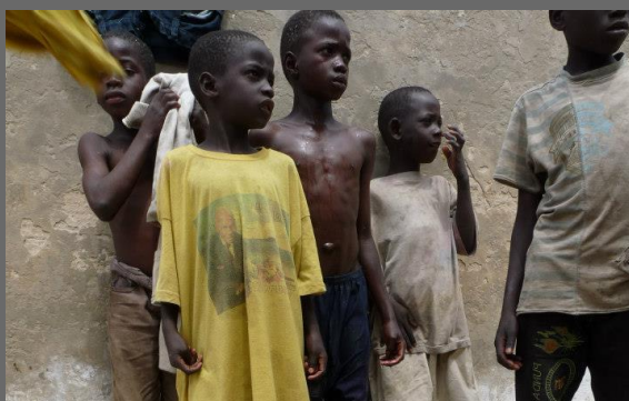
2) Alcuni studenti Talibè