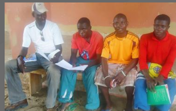
5) Corsi di alfabetizzazione