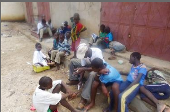
1) Meditazioni effettuate presso il mercato